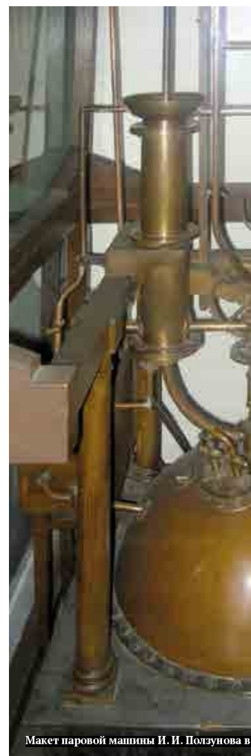
Макет паровой машины И. И. Ползунова в

Суть «государственного планирования» заключалась в том, что всю экономию топлива, получаемую при комбинированном производстве тепловой и электрической энергии, полностью относили в пользу потребителей электрической энергии. При этом тепловая энергия, производимая на ТЭЦ, имела заведомо худшие показатели. Затраты топлива на ТЭЦ были на 5-7 процентов больше, чем затраты топлива на производство тепла от заводских и коммунальных котельных (172-174 кг/Ткал против 163-165 кг/Ткал). Однако именно это решение позволяло государ-