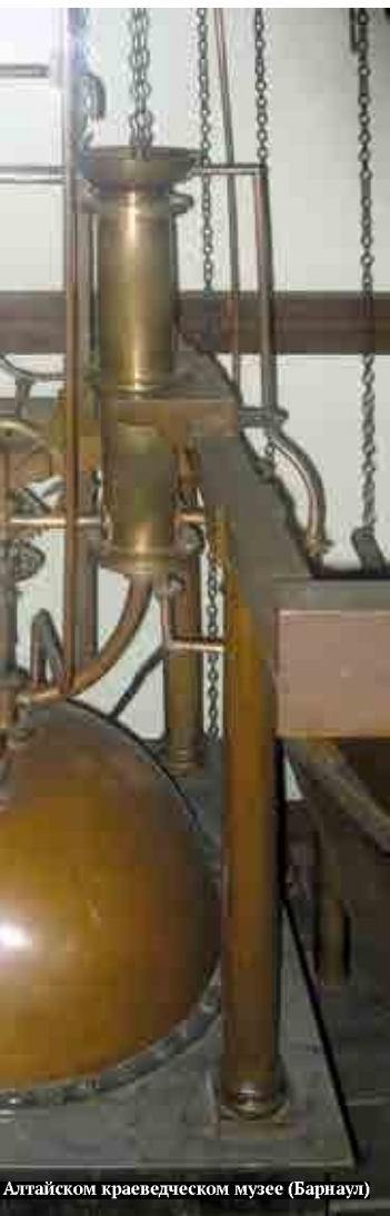
Алтайском краеведческом музее (Барнаул)

вития дальнего централизованного теплоснабжения. Данный график позволял совместить комбинированное производство тепловой и электрической энергии на ТЭЦ и раздельное теплоснабжение от пиковых котельных. До 1992 года, пока был народный и партийный контроль над содержанием тепловых сетей и систем потребления тепла, температурный график пытались выдерживать. Однако с приходом так называемых рыночных отношений график стал массово не исполняться, и в последние пятнадцать лет системы теплоснабжения работают с температурой не выше 100–110° С, не обеспечивая экономичную нагрузку теплофикационных систем.